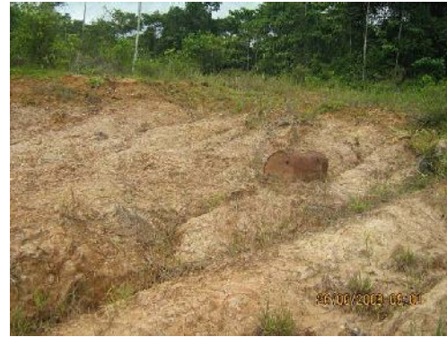
Gambar 7. Singkapan batupasir konglomeratan dijumpai di tepi sungai aroba