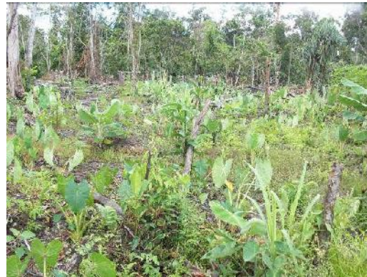
Gambar 3. lahan untuk tanaman pangan berupa keladi

Masyarakat membuka lahan dengan cara menebanghutan dan kemudian membakar sisa kayu untuk memudahkan penyiapan lahan untuk budidaya tanaman (Gambar 2.)