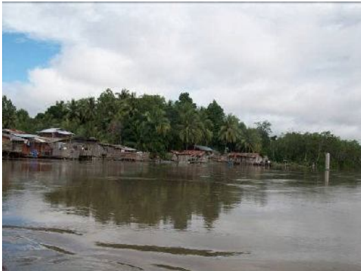
Gambar 6. Rumah sebagian warga di pinggir sungai untuk kebutuhan MCK

Sungai sungai besar dan utama digunakan sebagai sarana transportasi. Yaitu dengan ketinting, longboard dan speedboard, bahkan kapal tongkang dan kapal penarik tongkang (Gambar 6).