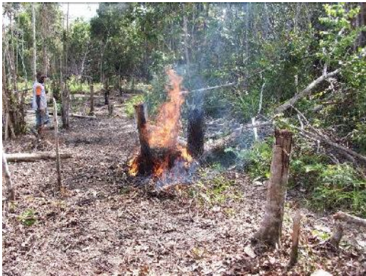
Gambar 2. Pembukaan lahan dengan cara membakar tanaman yang ada

Tanah sebagai bentukan alam yang berasal dari bahan induk yang mengalami pelapukan dan proses pembentukan tanah. Sifat tanah dalam meloloskan air ke dalam tanah sangat dipengaruhi oleh sifat tanahnya, terutama tekstur. Tanah yang berkembang di Aroba mempunyai kandungan lempung yang tinggi. Material ini mempunyai sifat sangat lambat meloloskan air. Air hujan yang jatuh ke permukaan tanah tidak mudah masuk ke dalam tanah, akan tetapi mengalami penggenangan di permukaan.